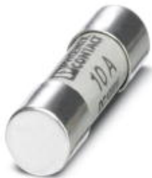
Biztosító, 10,3x38 mm, 1000 V DC-ig, gPV karakterisztika

Kérjük, vegye figyelembe, hogy az itt megadott adatok az online katalógusból származnak! Teljes körű tájékoztatást a felhasználói dokumentáció tartalmaz. Az internet-letöltés általános használati feltételei érvényesek. ( http://download.phoenixcontact.de )